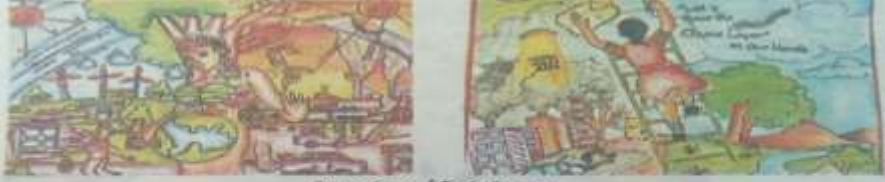
విద్యార్థులు గీసిన చిత్రాలు