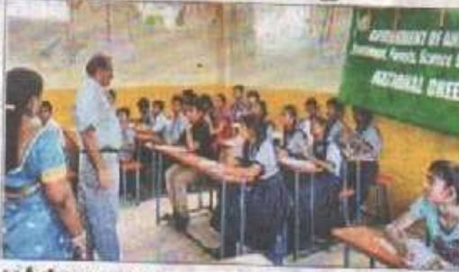
పోటీల్లో పాల్గొన్న పాఠశాలల విద్యార్థులు